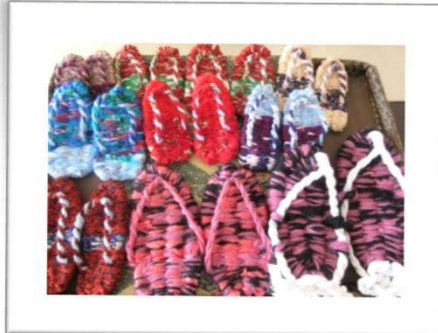
布で作ったぞうりとわらじ