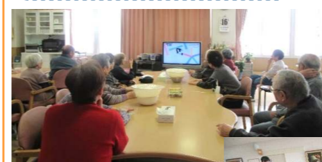
↑これは羽生君を応援する 金曜日の皆さんです。熱い 応援は、テーブルの上のパン 生地にも伝わりすごい膨らみに!

白熱した冬季オリンピックが終わってしまいましたね。 羽生選手がショートプログラムの試合があったのは、金曜日。 みなさん昼寝もそこそこに応援をし、演技終了後は涙・なみだ...!! こんなにスポーツで盛り上がったのは初めてでしたね!